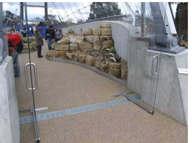
I Giardini Botanici Reali , Richmond, Inghilterra