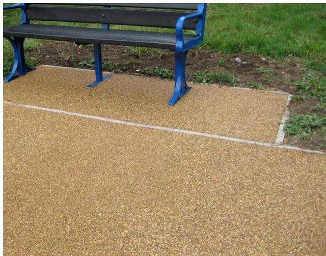
Parco, Harlow, Inghilterra