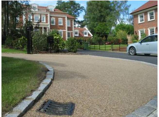
Villaggio Ide Hill, distretto di Sevenoaks del Kent, Inghilterra