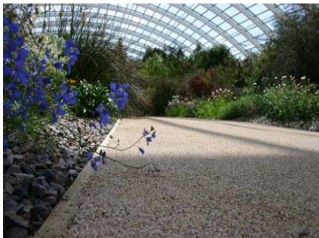
Il Giardino Botanico Nazionale, Gales, Inghilterra (Norman Foster)